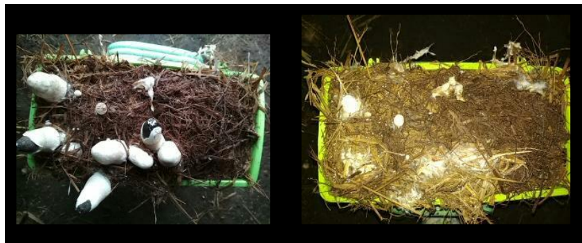
(a) (b) Gambar 1. Tubuh Buah Jamur Merang pada Perlakuan: (a) C1: 1000 gram Jerami Padi dan 0 gram Kulit Jagung (Terbaik) dan (b) C5 (0 gram Jerami Padi dan 1000 gram Kulit Jagung)

Kandungan nutrisi dalam 100 gram jerami padi terdiri dari selulosa sebanyak 29,63%, dengan kandungan hemiselulosa sebanyak 17,11% dan lignin sebanyak 12,17% (Hartini, 2012). Jerami padi biasanya dibakar atau dimanfaatkan sebagai pakan ternak. Jerami padi mempunyai serat yang tinggi tetapi proteinnya rendah. Jerami berfungsi sebagai substrat tempat menempelnya miselium dan sumber nutrisi, terutama karbon (Sukmadi et al. 2012 dalam Rahmawati, 2016). Pada umumnya jamur merang tumbuh pada media yang mengandung selulosa seperti jerami padi. Jerami padi mengandung 30-45% selulosa, 20-25% hemiselulosa, 15-20% lignin, dan silika (Agency, 2011). Selulosa merupakan karbohidrat utama bagi jamur, yang mana karbohidrat dibagi menjadi 3 yaitu polisakarida, disakarida, dan monosakarida. Pada proses pengomposan terjadi penguraian secara biologis yang melibatkan mikroorganisme. Mikroorganisme menguraikan polisakarida menjadi disakarida dan menguraikan kembali menjadi monosakarida. Monosakarida diuraikan menghasilkan glukosa dan fruktosa yang mana merupakan senyawa karbohidrat yang mengandung carbon. Karbon (C) sebagai unsur dasar pembentukan sel dan sebagai sumber energi untuk metabolisme sel (Suparti; Kartika; dan Ernawati, 2016).