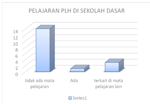
Diagram 1. Pelaksanaan Pembelajaran PLH di Sd di Manggarai

Sampel yang digunakan yaitu 20 sekolah dasar di wilayah Manggarai yang dikaji kebutuhan dan upaya penanaman pendidikan lingkungan hidup di sekolah. Sekolah yang digunakan untuk uji kebutuhan ini baik di sekolah di kota maupun di luar kota, yang dilakukan secara random. Studi kebutuhan ini pada dasarnya ditujukan untuk mendapatkan informasi tentang ada tidaknya PLH di SD, pola penerapan PLH di SD, dan perlu atau tidaknya mata pelajaran PLH di SD.