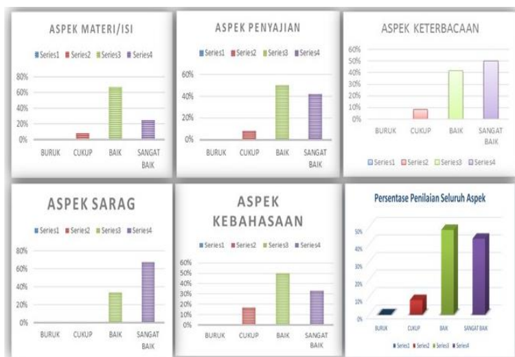
Diagram 5. Persentase Penilaian Kelima Aspek

Jika dilakukan perhitungan secara menyeluruh untuk kelima aspek yang dinilai, maka akan didapatkan hasil perhitungan yang menunjukkan bahwa kategori buruk: 0%, cukup: 8,33%, baik: 48%, dan sangat baik: 43%.