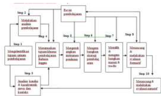
Gambar 2 Model Pengembangan Dick Carey & Carey (Gall, Gall & Borg, 2007)

Pengembangan Multimedia model Lee & Owens ( 2004)