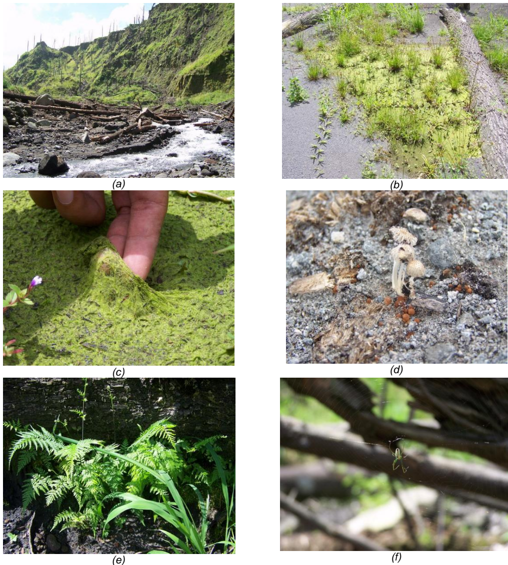
Gambar 3. (a) & (b) Gejala Dinamika Perubahan Ekosistem Wilayah Kali Kuning, (c)-(e) Beberapa Contoh Spesies yang Ditemukan di Wilayah Kali Kuning Sebagai Bagian Gambaran Dinamika Suksesi Pasca Erupsi Merapi 2010.

Proses suksesi yang terjadi di Merapi termasuk dalam kategori suksesi primer, akibat dari tidak tersisanya vegetasi di area yang terkena langsung dampak semburan produk vulkaniknya. Kecepatan suksesi dipengaruhi oleh beberapa faktor, seperti luasan daerah komunitas awal yang rusak, spesies tumbuhan yang muncul atau terdapat di lingkungan sekitar area tersuksesi, jenis substrat baru yang terbentuk dan kondisi iklim.