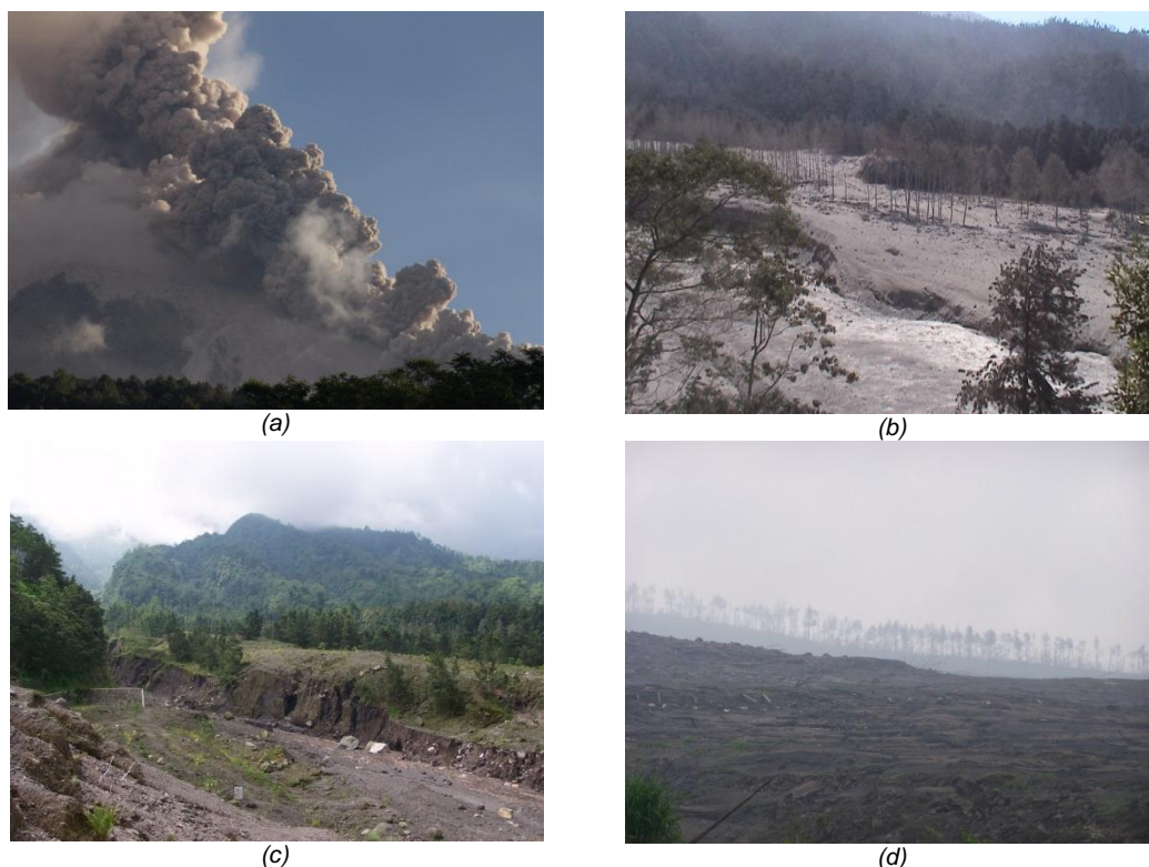
Gambar 1. (a) Meluncurnya Awan Panas Erupsi Merapi ke Lereng Selatan, (b) Kondisi Hutan Lereng Selatan Merapi Pasca Erupsi 2006, (c) Kondisi Hutan Lereng Selatan Merapi Pasca Erupsi 2006 Sebelum Erupsi 2010, (d) Kondisi Lereng Selatan Merapi Pasca Erupsi 2010.

Perubahan ekstrim berupa rusak atau bahkan hilangnya vegetasi berakibat terjadinya ketidakseimbangan ekosistem. Ketiadaan vegetasi tentu meng-hilangkan fungsi ekologi produksi gas oksigen bagi wilayah hilir Gunung Merapi dan ini tentu memberi dampak bagi kehidupan yang ada di sana. Dengan kata lain, siklus daur biogeokimia, khususnya daur oksigen dan nitrogen tentu akan mengalami perubahan.