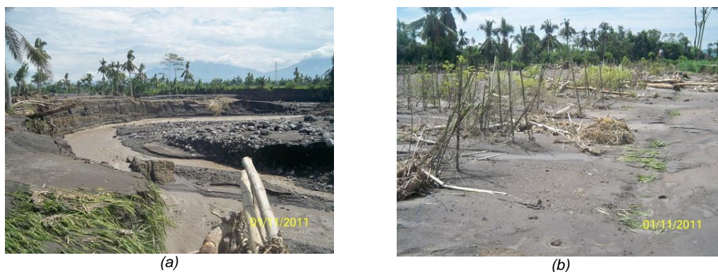
Gambar 2. (a) Topografi Daratan Pasca Banjir Lahar Dingin di Wilayah Magelang, (b) Kondisi Area Persawahan/Perkebunan yang Rusak Akibat Terjangkit Banjir Lahar Dingin.

Fenomena yang terjadi di wilayah Magelang, seperti ditunjukkan Gambar 2, menggambarkan betapa interaksi antar dua faktor abiotik tersebut mampu menimbulkan kekuatan alamiah luar biasa yang sanggup merubah kondisi lingkungan dan kehidupan. Berubahnya topografi aliran sungai, rusaknya sistem sumber daya khususnya air, rusaknya area produktif persawahan, merupakan gejala yang relevan dengan persoalan dinamika ekosistem.