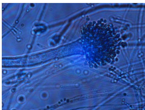
Gambar 2. Spesies Aspergillus sp pada tapai ubi jalar

Hasil penelitian identifikasi fungi tapai ubi jalar relevan dengan konsep pelajaran biologi siswa Sekolah Menengah Atas (SMA) pada kompetensi dasar “mendeskripsikan ciri-ciri dan jenis-jenis jamur berdasarkan hasil pengamatan, percobaan dan kajian literatur serta peranannya bagi kehidupan”. Materi pokok yang diajarkan kepada siswa meliputi ciri morfologi jamur, cara reproduksi jamur, penggolongan jenis jamur dan peranan jamur dalam kehidupan.