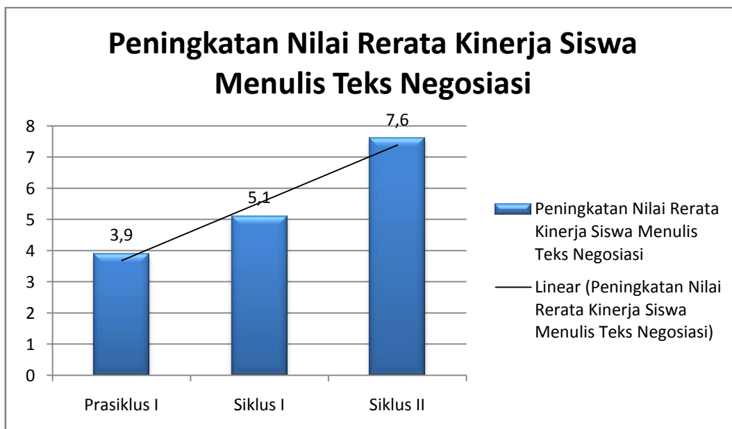
Gambar 1. Peningkatan Nilai Kinerja Siswa dalam Mengikuti Kegiatan Belajar Mengajar

Dari tabel tersebut, dapat kita lihat peningkatan keaktifan siswa dalam pembelajaran dari prasiklus ke siklus I sebesar 1,2 dan peningkatan keaktifan siswa dalam pembelajaran dari siklus I ke siklus II sebesar 2,5. Agar lebih jelas, peningkatan kinerja siswa dapat dilihat pada gambar 1.