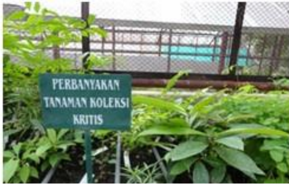
Gambar 4. Perbanyak Tanama kritis

Koleksi kritis merupakan koleksi yang tersisa 1 buah tanaman saja di kebun. Hingga tahun 2012 jumlah koleksi kritis adalah 404 jenis. Tercatat sekitar 37 jenis diperbanyak di seleksi dan pembibitan hingga 2012. Tujuan dari perbanyak adalah untuk menyulam koleksi kritis di kebun. Data koleksi kritis diperoleh dari unit registrasi. Tanaman hasil perbanyak koleksi kritis diaklimatisasi pada ruang pemeliharaan hingga siap ditanam sebagai koleksi di Kebun raya Purwodadi.