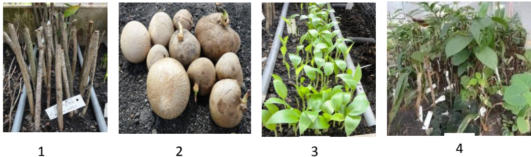
Gambar 1. Beberapa material tumbuhan: 1) material stek, 2) material bulbil, 3) material biji, 4) material split (anakan)

Aklimatisasi dilakukan terhadap material tanaman yang akan dijadikan koleksi di Kebun Raya Purwodadi. Tujuan utama dari aklimatisasi adalah menyiapkan bibit siap tanam untuk koleksi Kebun Raya Purwodadi. Proses aklimatisasi menentukan tingkat kehidupan material yang ditanam. Material tumbuhan dapat berupa vegetatif (seedling, split/anakan, umbi, rhizoma, bulbil dan stek) dan generatif (biji dan spora). Pada material spora ditanam pada media moss dan dibungkus rapat.